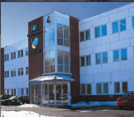
Bryn, Oslo. Medinor ASA har også kontorer i Sandnes, Bergen og Trondheim.