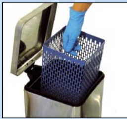
ART. NR. MH1952 Kurv liten: H12x88xD16 cm Veil. pris eks. mva 650,- Veil. pris inkl. mva 812,50