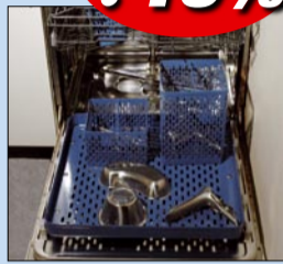
ART. NR. MH1953 Kurv medium: H17x81xD13 cm Veil. pris eks. mva 700,- Veil. pris inkl. mva 875,-