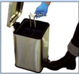
ART. NR. MH1950 Pedalbøtte 12 Veil. pris eks. mva 490,- Veil. pris inkl. mva 612,50