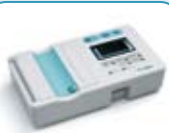
Welch Allyn CP 50 Overfør informasjon via USB