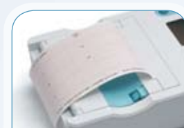
LETT Å AVLESE

Du sparer verdifull tid, og kan være sikker på nøyaktig EKG registrering, med varslings om dårlige signaler.