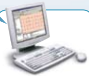
Welch Allyn CardioPerfect™ Workstation

Registrer testdata og pasientinformasjon i individuelle pasientjournaler i ditt journalsystem for analyse og permanent lagring